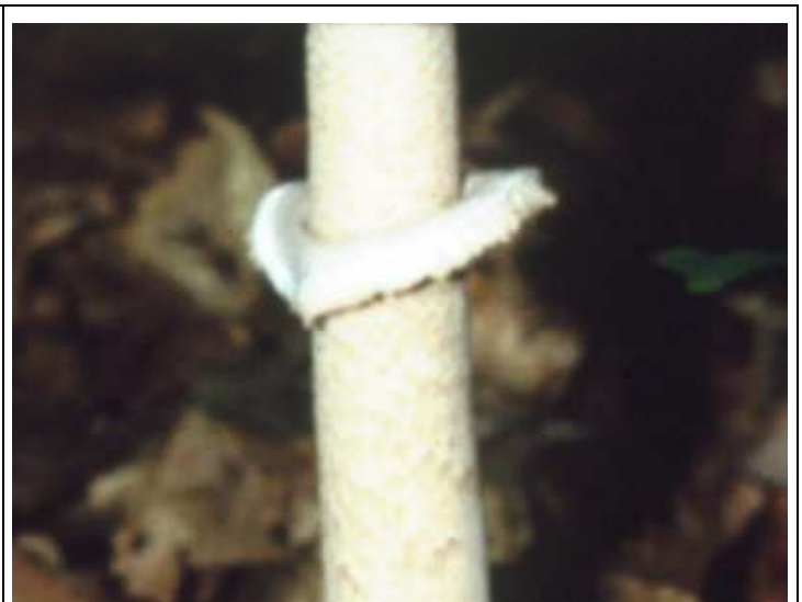
Ring „einfach, häutig“