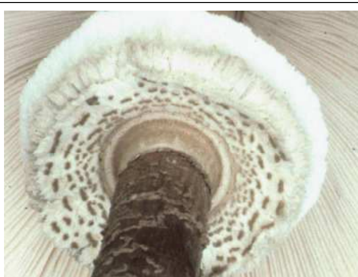
Ring komplex „mit Laufrille“

(b) Einfach, häutig und ohne „Laufrille“