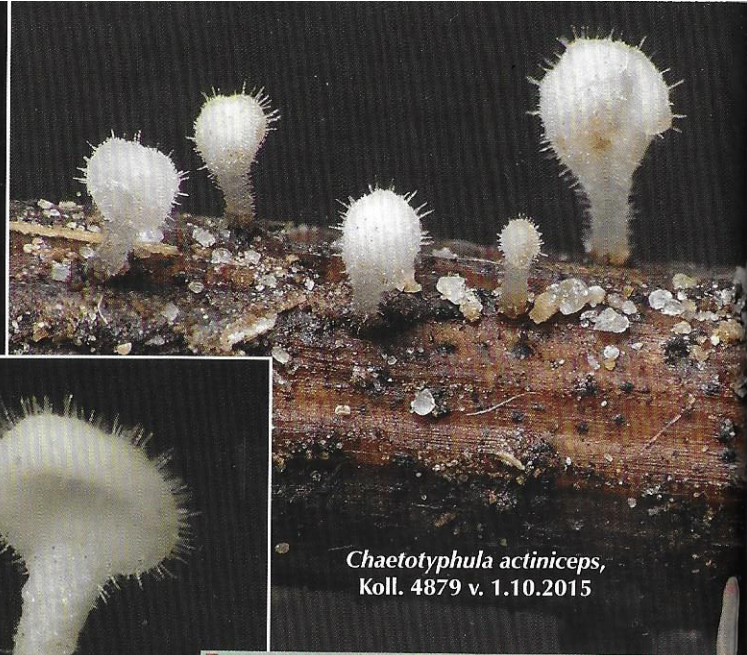
Chaetothyphula actiniceps , Koll. 4879 v. 1.10.2015