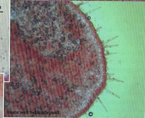
Haare weit herausragend

Es bekam den Namen Chaetothyphula actiniceps (Petch) Corner, mit dem Zusatz, dass die Bestimmung noch abzuklären sei. Zwei Jahre