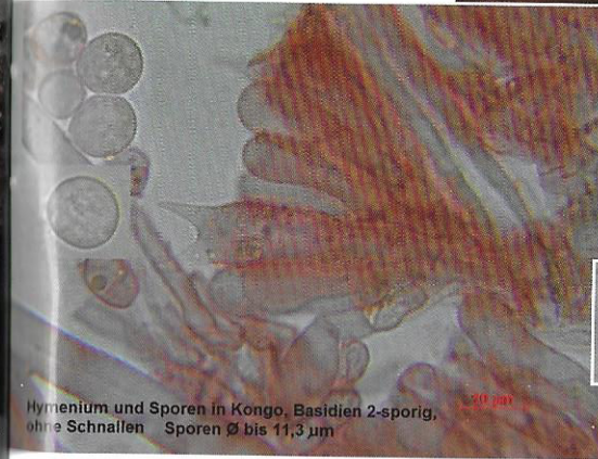
Hymenium und Sporen in Kongo. Basidien 2-sporig, ohne Schnallen Sporen Ø bis 11,3 µm

Beschreibung dieser Art, so DOMÍNGUEZ, bestünde darin, dass auch einige 4-sporige Basidien gefunden wurden.