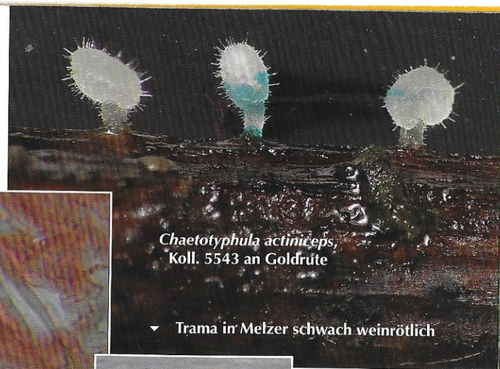
Chaetothyphula actiniceps , Koll. 5543 an Goldrute

später, am 09.10.2017 tauchte das Pilzchen erneut auf, diesmal an Goldrute ( Solidago ). Der Pilz hat das Aussehen eines Fadenkeulchens ( Typhula ), nur dass seine komplette Oberfläche mit langen, dickwandigen Ha-