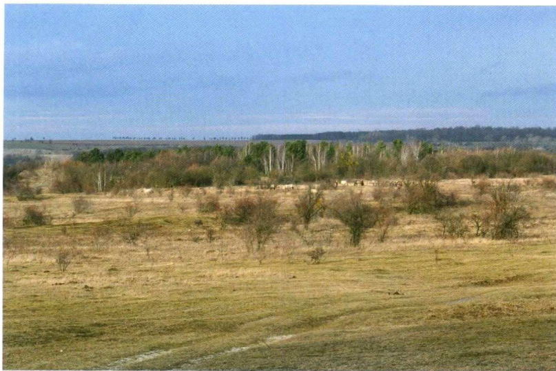
Abb. 1: Weide auf der Hochfläche „Der Rödel“, Fundort von Poronia punctata, in Bildmitte in Miniatur Koniks.