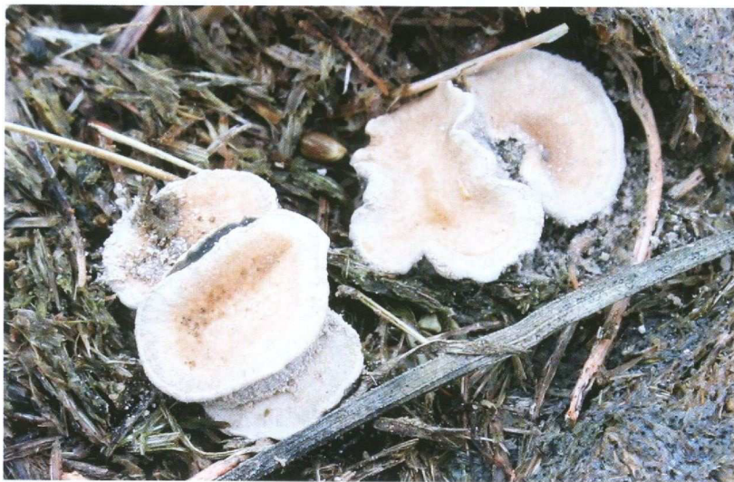
Abb. 3: Conidiogene Stromata am Fundort auf Pferdeexkrementen.