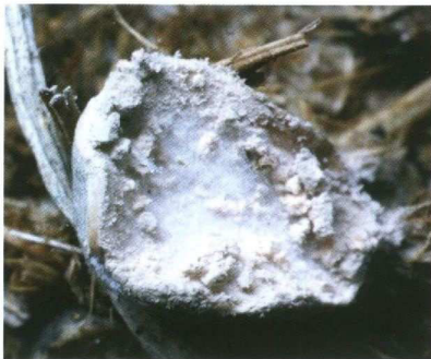
Abb. 4: Blick auf die conidiogene Oberseite eines Stromas (Foto: W. HUTH, 3.1.2013).