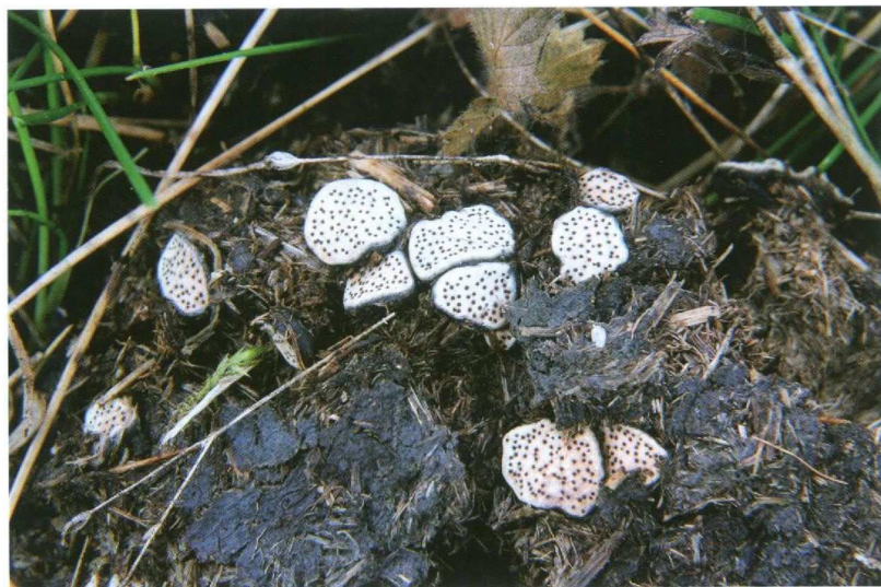
Abb. 2: Stromata mit fertilen Perithezien am Fundort auf Pferdeexkrementen.

Sporen schwarz, in Frontalansicht (Keimspalte median gelegen) ellipsoid, überwiegend (23)24–26,5 x 12–13 µm (einige Sporen in achtsporigen Asci auffallend schlank, diese bis 29,5 x 11,5 µm), Keimspalte 9,5–11,5 µm lang, frei liegende Sporen von 8,5–11 µm breiter Gallerthülle umgeben (Abb. 7; Sporen aus exsikkariertem Material zeigten keine Gallerthülle mehr).