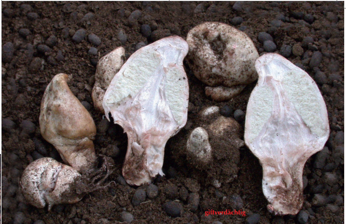
Chlorophyllum agaricoides , ein bauchpilzähnlicher Safranschirmling.

Sowohl Chl. rachodes als auch Chl. brunneum wurden oft als M. bohemica oder M. rachodes var. hortensis bezeichnet, allerdings sind diese beiden Namen nicht gültig veröffentlicht worden (Datum für den Typusbeleg fehlt bei Lepiota bohemica , keine lateinische Diagnose bei L. rachodes var. hortensis ; siehe VELLINGA 2003a). M. rachodes var. hortensis ist jedoch nicht zu verwechseln mit Chl. hortense (Basionym Lepiota hortensis Murrill), einer außereuropäischen Art. Eine Übersicht über die Verwendungen der Epitheta bohemica , brunnea , hortensis und rachodes in der Literatur gibt VELLINGA (2003a, 2006b).