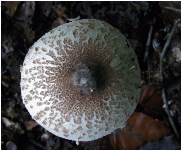
Die Fotos zeigen den Zitzen-Riesenschirmling Macrolepiota mastoidea s. l. Aufgrund des schlanken Habitus und der feinen, dunklen Hutschuppen kann man das Exemplar M. rickenii zuordnen.