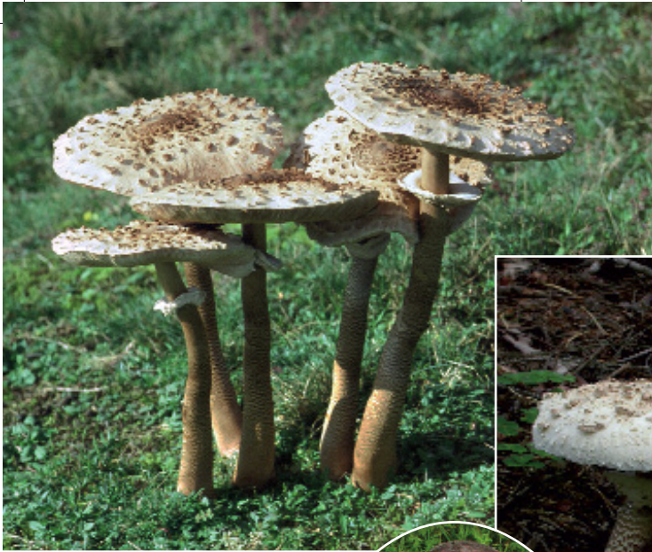
Gewöhnlicher Riesenschirmling, Parasol, Macrolepiota procera f. procera .