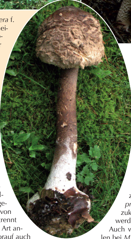
Macrolepiota procera f. fuliginosa unterscheidet sich von f. procera durch dunkler gefärbte Fruchtkörper mit schwächer genatterten Stielen und bei Verletzung häufig rötlich verfärbender Stielrinde.

doch aufgrund der makroskopischen Unterschiede ein Formastatus gerechtfertigt erscheint. M. fuliginosa ss. Lange & Vellinga ist allerdings genetisch sehr wohl von M. procera s. l. getrennt und kann als eigene Art angesehen werden, worauf auch schon VELLINGA (2001c) hinweist. Als anwendbare Namen kommen folglich M. konradii und M. fuliginosa nicht infrage und so bleibt der Name M. rhodosperma übrig, der bereits von VELLINGA (2001c) in die Synonymie von