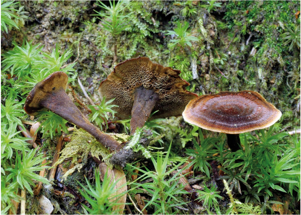
Abb. 1 – Coltricia cinnamomea am Standort, Kollektion 1.