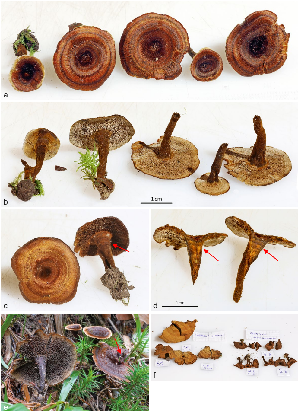
Tafel 1a-f – a) C. cinnamomea glänzende Hutoberflächen mit gut erkennbarer konzentrischer Zonung und radialer Streifung sowie teils gefransten Huträndern, Kollektion 1, b) Hymenophor, Kollektion 1, c) Stiel gebändert, Kollektion 3, d) Trama, im Stiel gebändert, Kollektion 3, e) mit eingewachsenem Gras, Kollektion 2, f) Esikkate, direkter Vergleich C. perennis (links) – Coltricia cinnamomea (rechts)