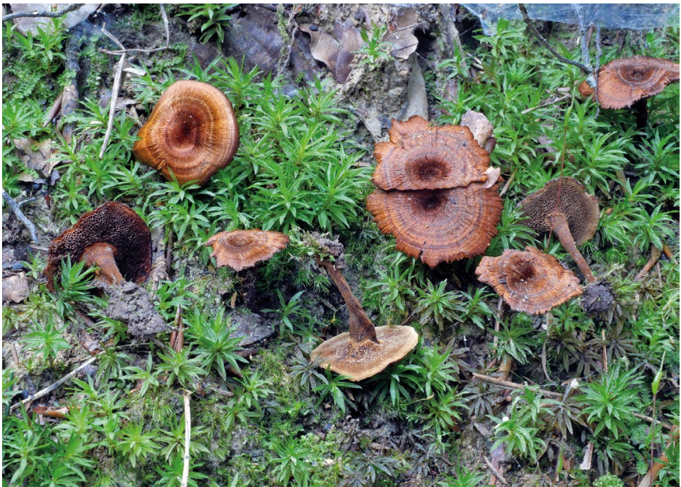
Abb. 2 – Coltricia cinnamomea am Standort, Kollektion 3.