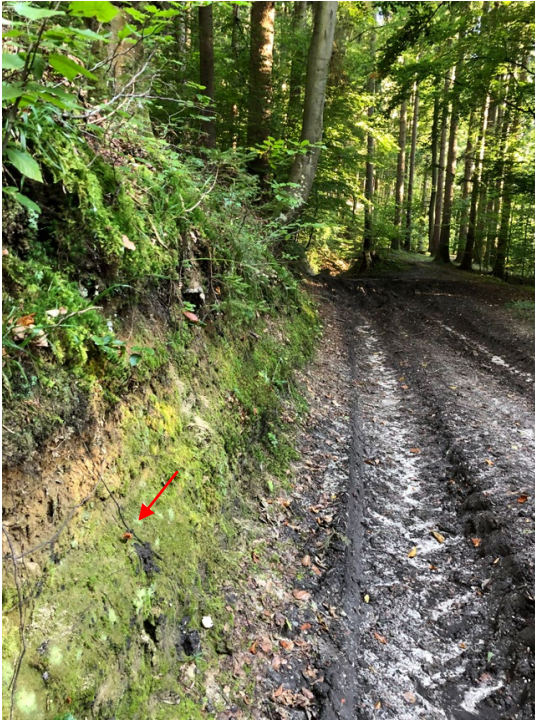
Abb. 3 – Fundort, Wachstum der Pilze an der hier fast senkrechten Böschung neben dem Weg, Kollektion 3

In Bayern gibt es von Coltricia cinnamomea It. Datenbank der DGfM erst drei Nachweise, je einer im Berchtesgadener Land, im Nationalpark Bayerischer Wald sowie im Raum Coburg, deutschlandweit insgesamt 49 Nachweise (DGfM 2022). Das Vorkommen von Coltricia cinnamomea in den niederbayerischen Innleiten zeigt einmal mehr, dass „seltene“ Pilze oft nur an wenigen Fundorten gefunden werden, dort aber durchaus in größerer Stückzahl gedeihen können. Die Innleite mit dem angrenzenden Hinterland scheint der hier beschriebenen Art jedenfalls zuzusagen.