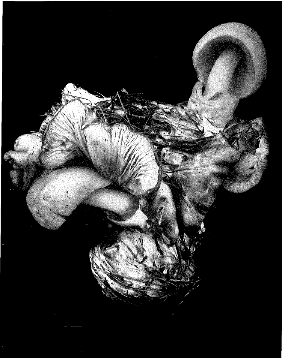
Volvariella surrecta (Knapp.) Sing. auf einem Fruchtkörper von Clitocybe nebularis (Batsch ex Fr.) Quel. parasitierend. Fundort: Altenau bei Saulgrub, Lkr. Garmisch-Partenkirchen, 28. 9. 1963. Beleg im Staatsherbarium München (M).